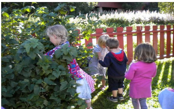
Plukking av solbær i barnehagen

Barna skal ha utelek i barnehage hver dag.